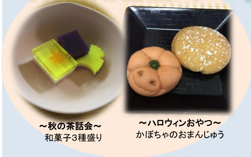
～秋の茶話会～ 和菓子3種盛り