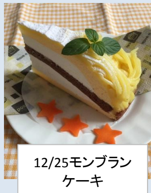
12/25モンブラン ケーキ