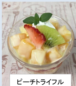
ピーチトライフル