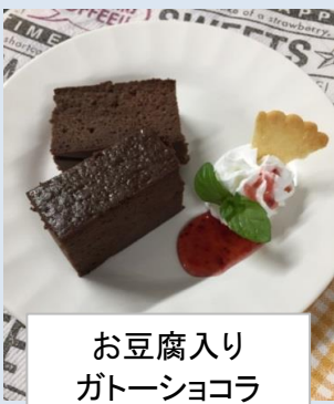
お豆腐入り ガトーショコラ