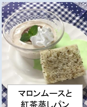
マロンムースと 紅茶蒸しパン