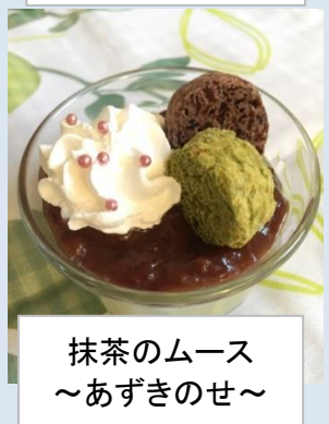
抹茶のムース ～あずきのせ～