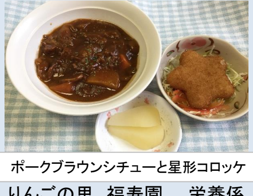
ポークブラウンシチューと星形コロケ りんごの里 福寿園 栄養係