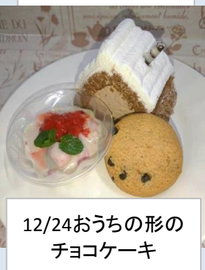
12/24おうちの形の チョコケーキ