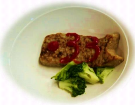
こいのぼりハンバーグ