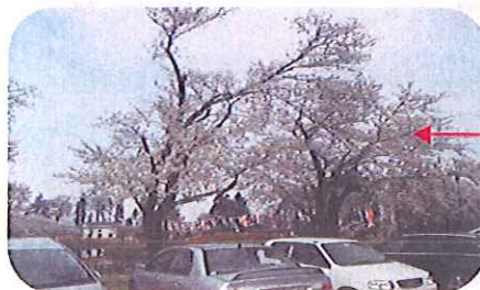
梨の木公園の桜です

かっぱ寿司に着き、お寿司を食べ始めると車中はあんなに賑やかだったのにみなさん黙々と好きなお寿司を食われていました。帰りの車では、「腹いっぱいだ」「うめがった。ありがとう」などと、みなさん笑顔で話されていました。入居者のみなさんが楽しめるよう、また、計画を立てドライブ等に行きたいと思いました。